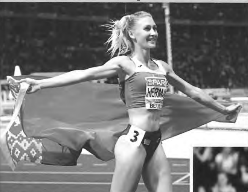
Эльвира Герман — чемпионка Европы — 2018 (бег 100 м с барьерами)