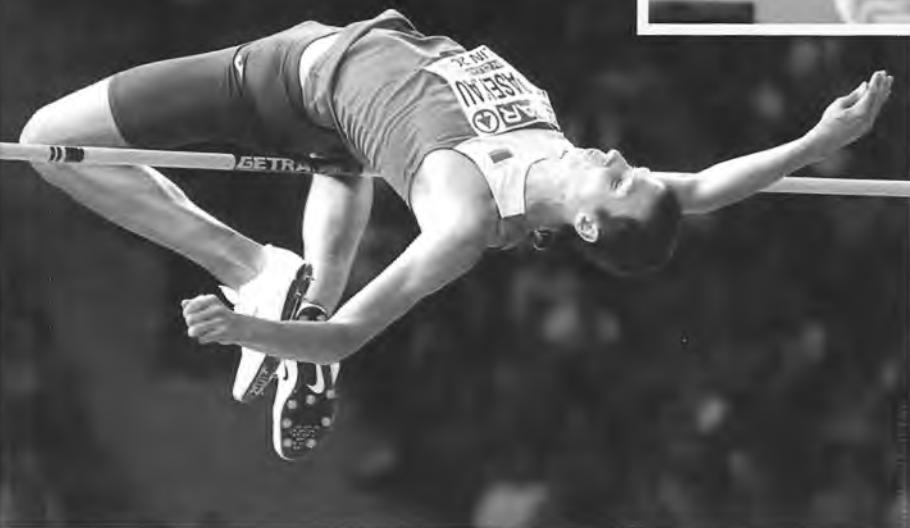
Максим Недосеков — серебряный призер чемпионата Европы — 2018 (прыжки в высоту)