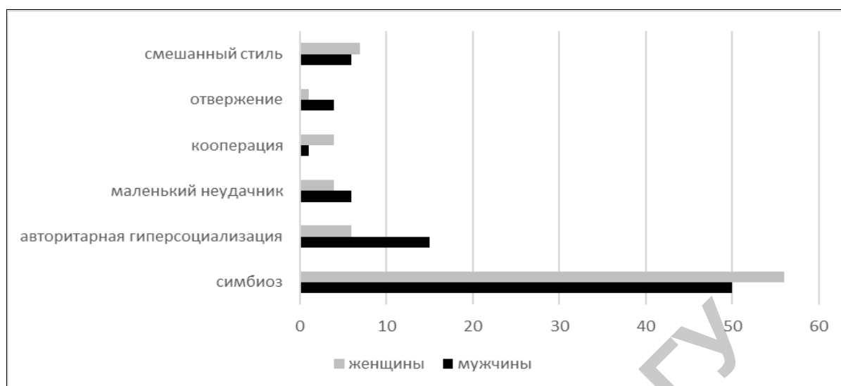
Рисунік 1. – Стили воспитания у отцов и матерей

Дальнейший анализ был направлен на выявление того, совпадают ли стили роди-