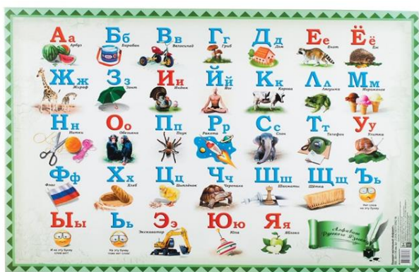
Рисунок – 3 Пример набора букв алфавита русского языка с эмодзи

В помещении класса можно размещать на стендах различную информацию и с помощью эмодзи, например, показ того, как надо сидеть, вести себя на уроке.