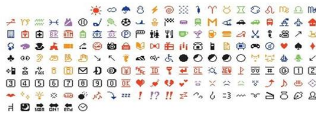
Рисунок 1 - Первый набор из 172 символов эмодзи размером 12×12 пикселей

Первый набор из 172 символов эмодзи размером 12×12 пикселей был разработан в составе функций обмена сообщениями для i-mode с целью облегчения электронного общения и стал характерной особенностью, отличающей эту платформу от других служб (рисунок 1).