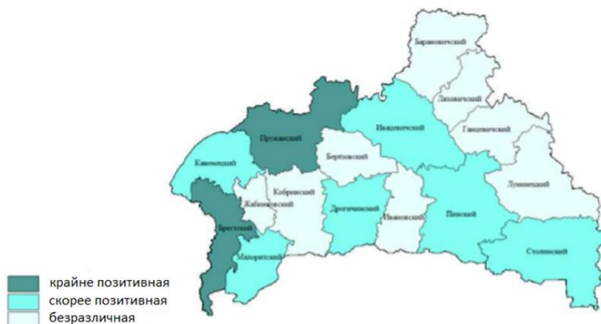
Рисунок 1- Оценка природных ресурсов Брестской области [1]

Из рисунка 1 можно заметить, что оценка природных ресурсов республиканского заказника «Прибужское Полесье» крайне позитивная.