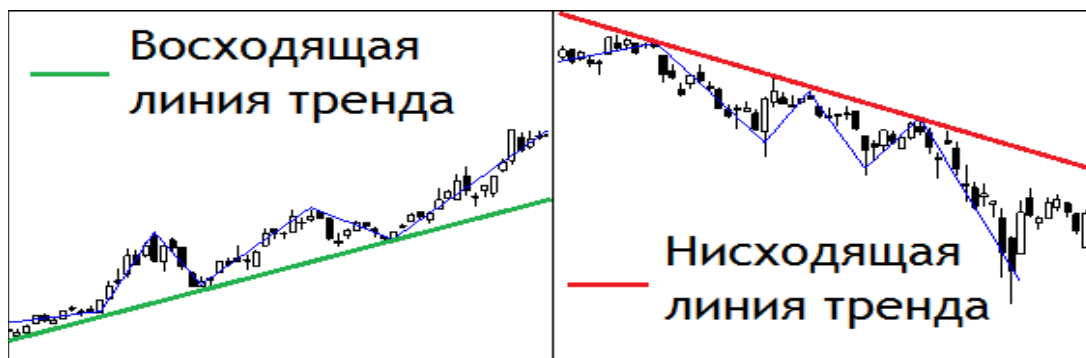
Рисунок 1. – Линия тренда

показателей (рисунок 1). Криминологические прогнозы в качестве своей важнейшей цели ставят выявление тренда преступности в будущем.