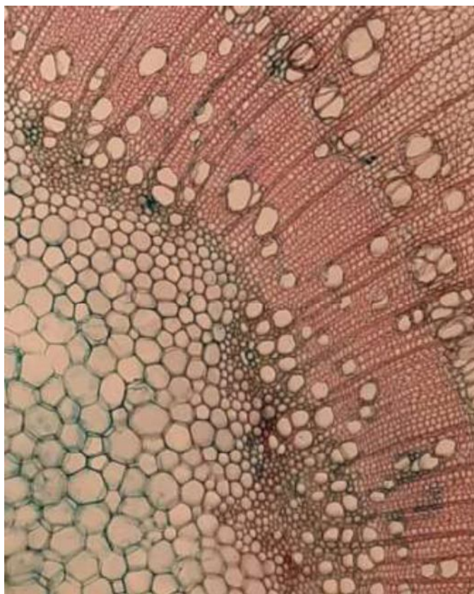
Рисунок – 1 Фрагмент поперечного среза однолетнего стебля катальпы прекрасной

однолетнем стебле исследуемого вида можно считать рассеяннососудистой. Количество просветов не превышает 100 на 1 \text{ мм}^2 . Средний диаметр просветов составляет более 50 мкм и варьирует в пределах от 25 до 100 мкм. Длина члеников сосудов 100 – 150 мкм. Согласно шкалы стандартных обозначений диаметров просветов [1], можно сказать, что просветы у исследованного нами вида относятся к классу малых. По длине же членики сосудов относятся к классу коротки, перфорация в члениках сосудов простая. Поперечные стенки или перпендикулярны, или слабо наклонены к продольным. Поры округлые или овальные, окаймленные, в местах контакта с паренхимными клетками более крупные, поровость очередная.