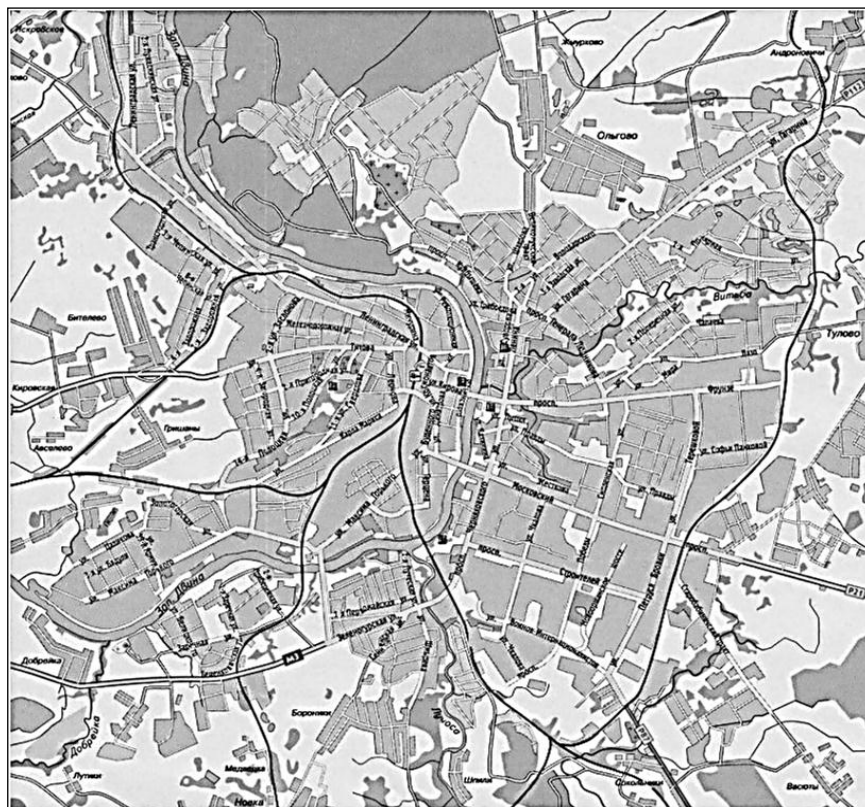
Рисунок 1. – План Витебска и его окрестностей (по [8])

Усадебную застройку предполагается развивать в периферийной части города, в секторах между магистральными улицами, а также с постепенной реконструкцией ветхого усадебного фонда из центральной и срединной зоны (районы усадебной застройки «Тулово», «Бителево», «Орехово», «Аксановка», «Ольгово» и др.) [9].