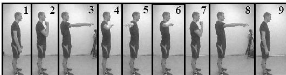
Рисунок 2 – Тестовое задание со сложной двигательной структурой для рук