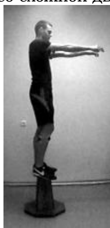
Рисунок 3 – Тестовое задание со сложной двигательной структурой на повышенной и уменьшенной опоре

Данные комплексы упражнений соответствовали требованиям спортивной метрологии по критериям надежности и информативности. Комбинации двигательных действий являлись доступными для испытуемых и обладали элементами новизны, что позволяло определять уровень проявления всех видов координационных способностей (ритм, согласованность движений, приспособление и перестроение двигательных действий, равновесие, дифференцирование пространственно-временных параметров движений, ориентирование в пространстве, вестибулярная устойчивость, способность к быстрому реагированию, к произвольности мышечного напряжения). Выполнение тестовых заданий не требовало предварительного специального обучения. Условия организации и проведения эксперимента стандартизированы и воспроизводимы, не зависят от возрастных изменений размеров тела, его звеньев и от массы тела, выполняются «ведущими» и «неведущими» верхними и нижними конечностями.