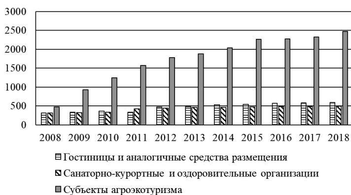
Рис. 1. Динамика числа отдельных объектов туристической индустрии за 2008–2018 гг.

Приоритетным направлением туристической политики в Беларуси является создание благоприятных условий для развития внутреннего и въездного туризма. С 2000 года в стране принимаются целевые программы по развитию туризма, которые за прошедший период внесли положительный вклад в развитие туристической инфраструктуры. Так, количество гостиниц и аналогичных средств размещения увеличилось за 2008–2018 гг. на 88 %, санаторно-курортных и оздоровительных организаций – на 56 %, а число субъектов агроэкотуризма увеличилось за этот период в 5,2 раза (таблица 1).