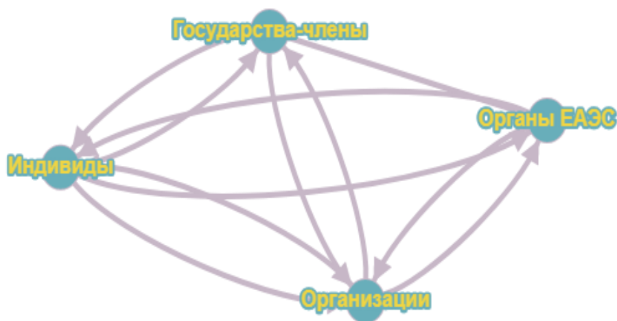
Рисунок 1 – Граф обмена в рамках политического рынка-ЕАЭС

Однако отметим и некоторые проблемы в существовании политического рынка-ЕАЭС как сети: