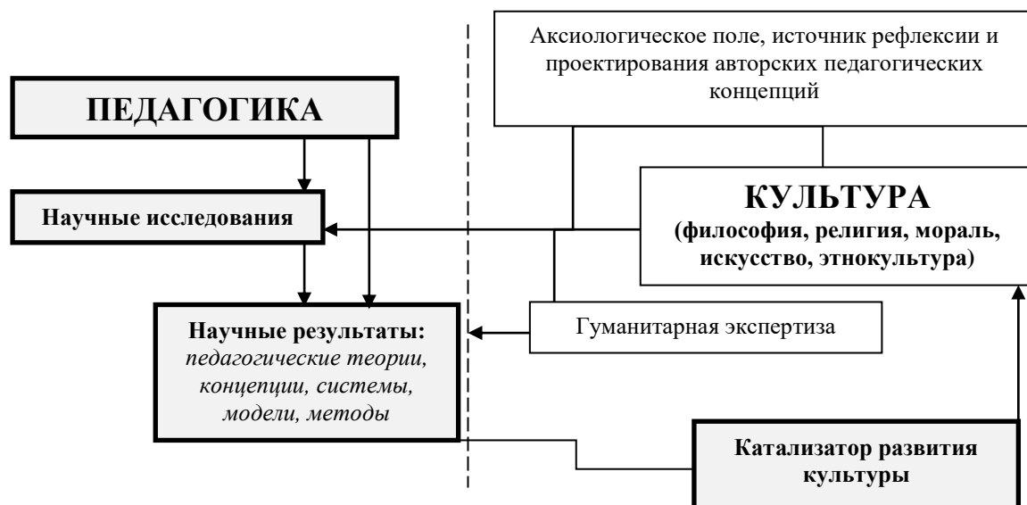
Рисунок 2 – Трансдисциплинарная методологическая стратегия педагогического исследования

ческих стратегий, подходов к исследованию образовательных феноменов. Очевидно, что более целесообразной является междисциплинарная методологическая стратегия педагогических исследований. Однако познание образования как целостности требует сопряженности мультинаучного и социокультурного подходов, интеграции философского, научного (научно-педагогического и междисциплинарного), метанаучного и вненаучного (например, художественно-образного, религиозного) знания – реализацию трандисциплинарной методологической стратегии педагогического исследования , обеспечивающей многомерную репрезентацию образования (Л.П. Киященко [3], Е.Н. Князева [4], И.А. Колесникова [5], Л.А. Микешина [7]).