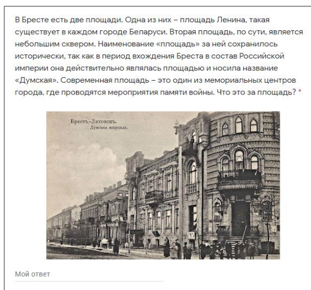
Рисунок 1 – Примеры вопросов, содержащих иллюстративный материал

После прохождения теста можно увидеть не только правильные ответы на вопросы, но и дополнительный комментарий к ответу. В дальнейшем можно составлять виртуальные экскурсии по улицам города или же реальные со ссылками на подобные тестовые задания (или их части); с помощью опросов – выявлять отношение жителей города к годонимам и т.д.