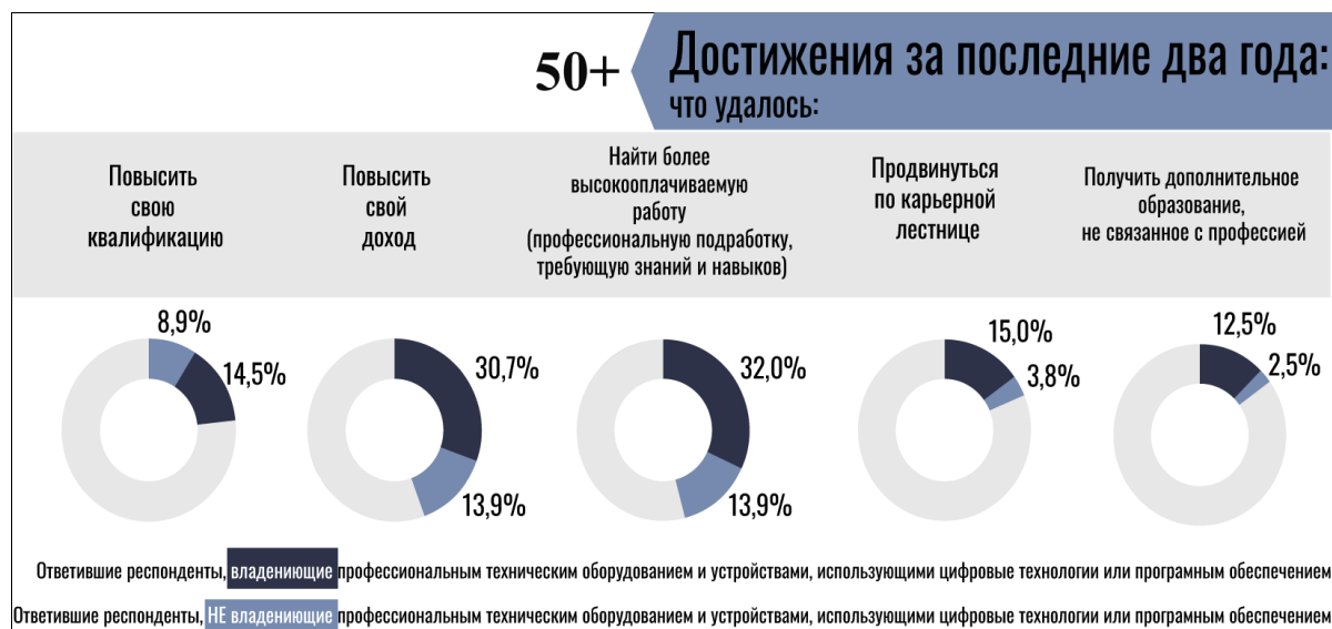
Рисунок 5. – Распределение ответов респондентов на вопрос: «Удалось ли Вам за последние два года:», %

ку данной гипотезы можно привести социологические данные, отражающие ряд профессиональных достижений работников с разным уровнем владения цифровыми компетенциями (рисунок 5).