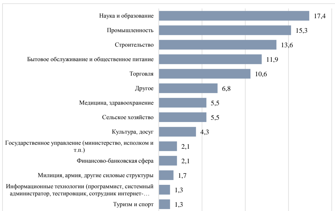
Рисунок 1. – Распределение ответов респондентов на вопрос: «Укажите, пожалуйста, сферу Вашей профессиональной деятельности», %