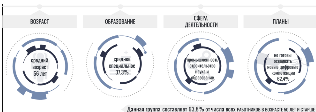
Рисунок 2. – Социально-профессиональный портрет работников, которые не освоили за последнее время новые цифровые навыки

Социальный портрет данной группы: средний возраст \pm 56 лет, в значительной мере (37,3 %) это работники со средним специальным образованием, а также примерно 1/5 часть – со средним общим и такая же часть – с высшим образованием, занимающие рабочие места в сфере промышленности, строительства, науки и образования, а также бытового обслуживания. Из них лишь 2 % планируют в будущем обновить свои знания и навыки; 35,6 % пока не планируют, но будут действовать по обстоятельствам, и 62,4 % не выразили готовности к освоению цифровых компетенций ни при каких обстоятельствах (рисунок 2).