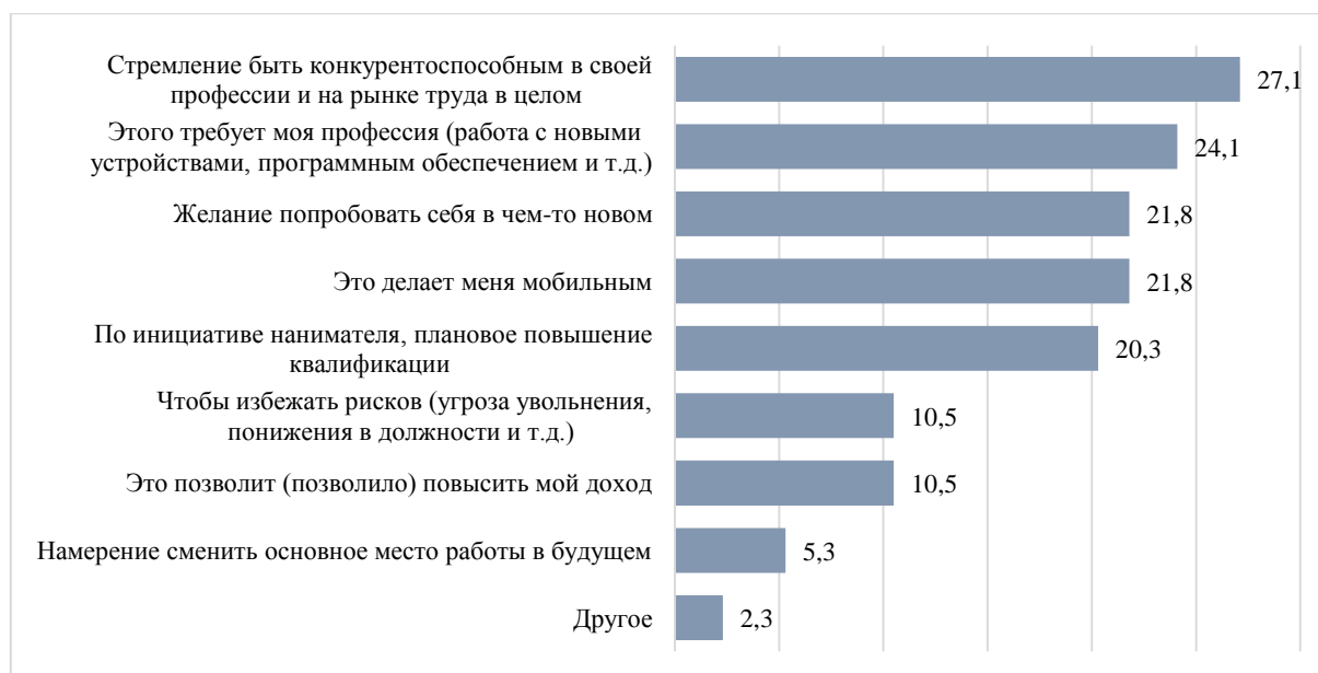
Рисунок 3. – Распределение ответов респондентов на вопрос: «Отметьте, пожалуйста, каковы Ваши мотивы получения новых цифровых навыков в рамках Вашей профессиональной деятельности?», %

фессиональным и карьерным траекториям развиваться нелинейно. Почти каждый шестой опрошенный планирует осваивать новое цифровое профессиональное оборудование, программы, сервисы для работы в ближайшие год-два. Примерно для 40 % вопрос остается открытым, и решение они будут принимать в зависимости от обстоятельств, что вселяет надежду и свидетельствует о невысоком уровне техностресса. В этом случае просматривается необходимость уточнения основных мотивов возможного переобучения. На первую позицию в рейтинге ответившие поставили желание быть конкурентоспособным на рынке труда; второе место, согласно оценкам, занимает профессиональная необходимость; на третьем месте – желание попробовать себя в чем-то новом и мобильность, каждый из этих вариантов выбрали около 1/5 ответивших (рисунок 3).