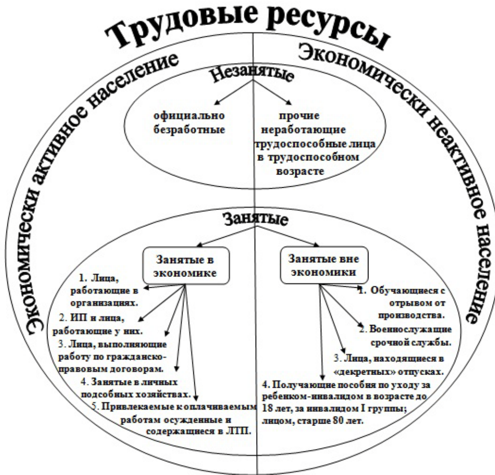
Рисунок 3 – Состав трудовых ресурсов