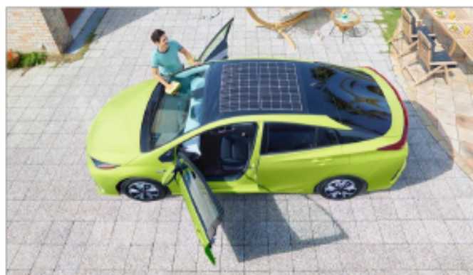
Рис. 3 – Авто оснащённое солнечной батареей

Такие автомобили пока не получили широкого распространения среди населения. Это объясняется высокой ценой и низким КПД по сравнению с обыкновенными транспортными средствами. Но технологии непрерывно развиваются, и вполне возможно, что через несколько лет производителям удастся создать мощные и надёжные солнцемобили, которые по своим характеристикам ни в чем не будут уступать машинам с бензиновыми двигателями.