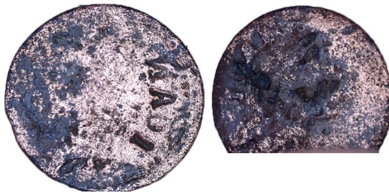
Рисунок 4 – Бракованный солид

Установить, какой именно монетный двор их отчеканил, не представляется возможным. Однако немаловажны исторический контекст их появления и связь с денежной реформой, после которой данный тип монет начал распространяться [1, с. 87–110].