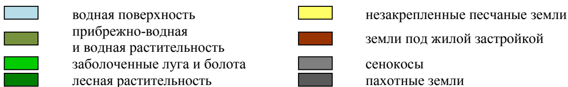
Рисунок 1. – Многолетняя динамика ландшафтов территории НПП «Нижнесульський»: а) апрель 1986 г.; б) апрель 2016 г.