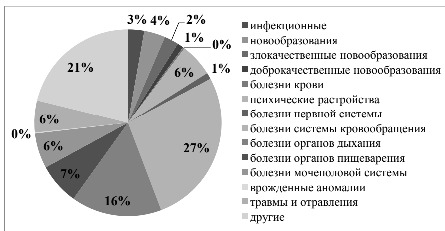
Рисунок 1. – Структура общей заболеваемости взрослого населения Брестской области за 2001–2018 гг.

Самые высокие уровни общей заболеваемости за период 2001–2018 гг. формируют одни и те же виды заболеваний (рисунок 1): болезни системы кровообращения, болезни органов дыхания и органов пищеварения, где на их долю в структуре общей заболеваемости приходится 27, 16 и 7 % соответственно. Самые низкие уровни заболеваемости занимают врожденные аномалии (пороки развития), деформации и хромосомные нарушения, болезни крови, кроветворных органов и отдельные нарушения, вовлекающие иммунный механизм, где показатель не превысил 1 %. Несколько большая доля отводится на злокачественные новообразования (2 %), заболевания нервной системы (1 %) и доброкачественные новообразования (1 %).