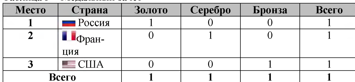
Таблица 3 – Медальный зачёт

1. http://volleybolist.ru/volejbolnaya-liga-natsij-2018-muzhchiny-raspisanie-turnirnaya-tablitsa-video.html