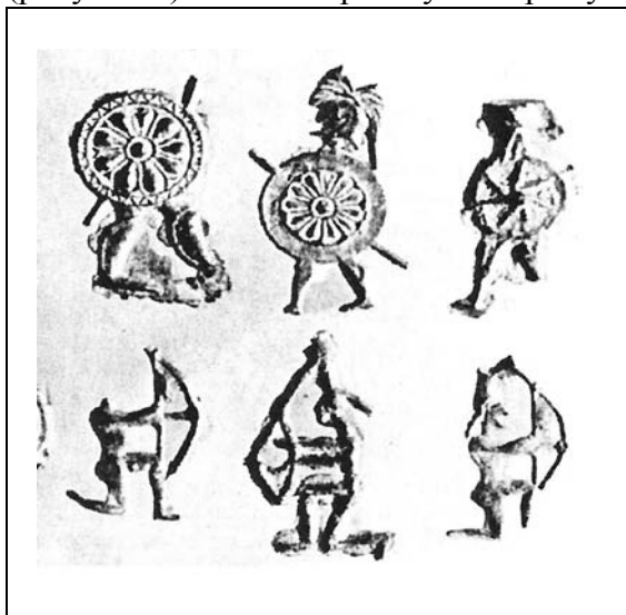
Рисунок 1 – Гоплиты и лучники (вотивные свинцовые фигурки из храма Артемиды Орфии)

У Гомера сами герои метают огромные камни. Тиртей уже упоминает легковооружённых ( gumnētes ) как особый род войск [Tyr. fr. 11, 35]. Но судя по свинцовым фигуркам из храма Артемиды Орфии, основным оружием легковооружённых является лук [1, с. 61] (рисунок 1). В то же время у Гомера лук используют герои.