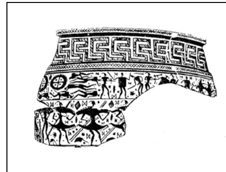
Рисунок 3 – Воины без защитного вооружения, среди которых воин в панцире (вазопись VIII в. до н.э.)

Противоречие разрешает фрагмент 19-й, где упомянуты бронзовые шлемы ( chalkeiai korythes ) [Tyr. fr. 19, 20]. Головной убор из бронзы назван korys , в данном контексте его можно перевести только как шлем [6]; защита головы обычного гоплита названа kunēē – шлем чаще кожаный (есть даже значение ' меховая или кожаная шапка') [6]; в любом случае они настолько разные, что поэт не объединяет их в одно понятие. Эта ситуация характерна для гомеровского времени и даже отражена в вазописи: в массе сражающихся выделяется фигура в панцире (рисунок 3) [14, с. 168].