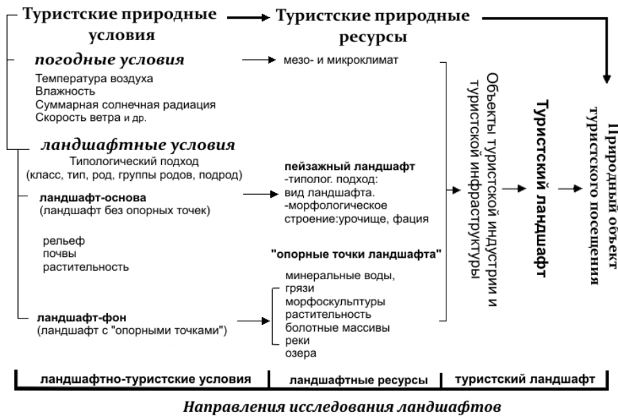
Рисунок 1 – Уровни туристских ландшафтных исследований