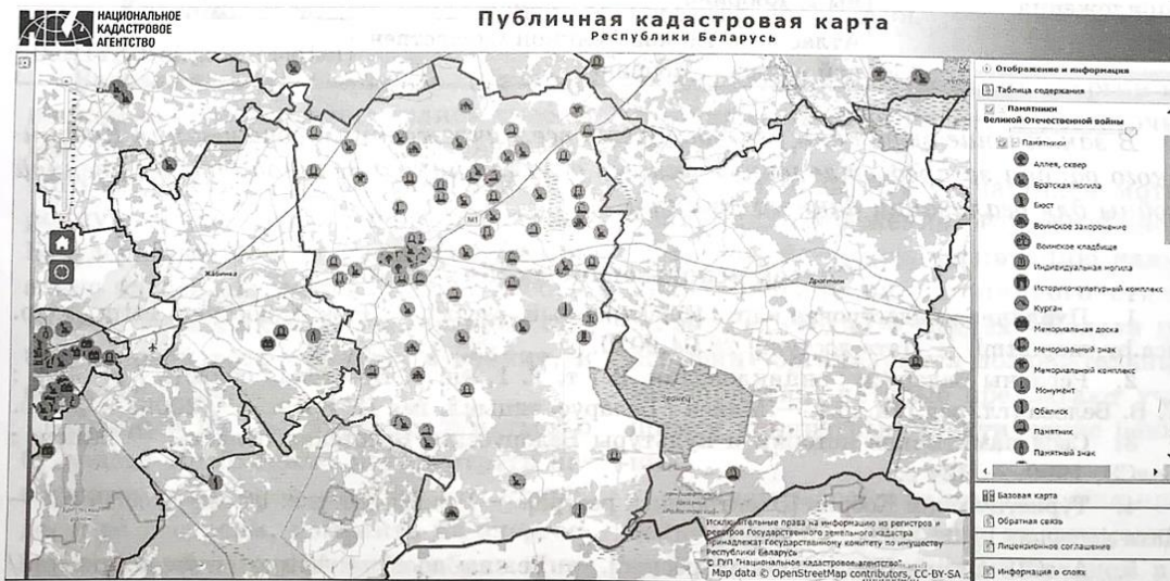
Рисунок 3 — Памятники Великой Отечественной войны Кобринского района на Публичной кадастровой карте Республики Беларусь

в виде текстовых документов или мультимедийных презентаций, что затрудняет их свободное распространение. Также в данных документах часто нет указания на точное местоположение объектов. Таким образом, выполненная работа по нанесению данных материалов на интерактивную карту позволяет систематизировать и распространять информацию о памятниках Великой Отечественной войны района.