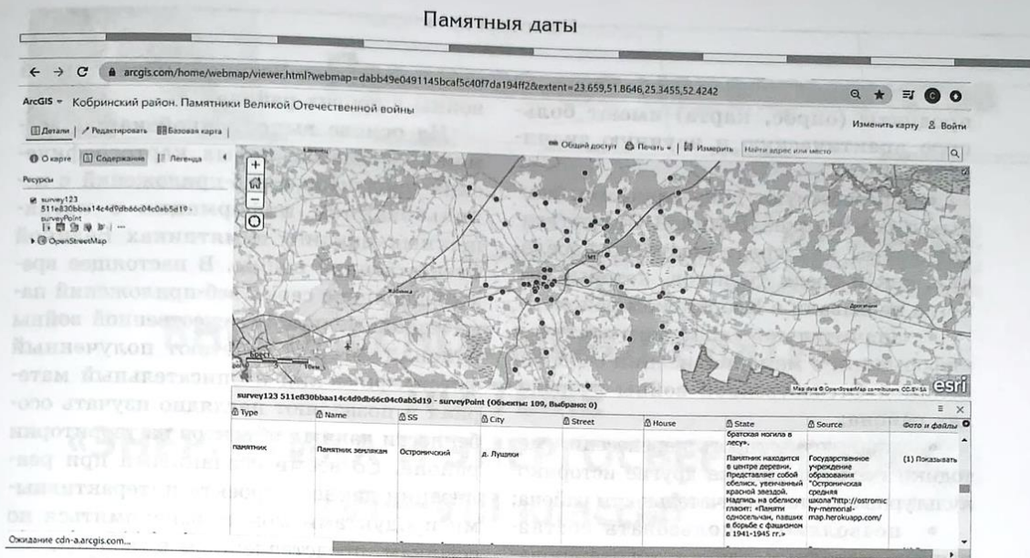
Рисунок 2 — Интерактивная карта и атрибутивная таблица памятников Великой Отечественной войны Кобринского района

Следует отметить, что многие школы Кобринского района ведут учёт памятников Великой Отечественной войны в пределах своих населённых пунктов или сельских советов и ухаживают за ними. В школах собран большой материал о памятниках войны: фотографии, описания, списки захороненных, карты проекта «Звёздочка на карте». В то же время данный материал чаще всего представлен