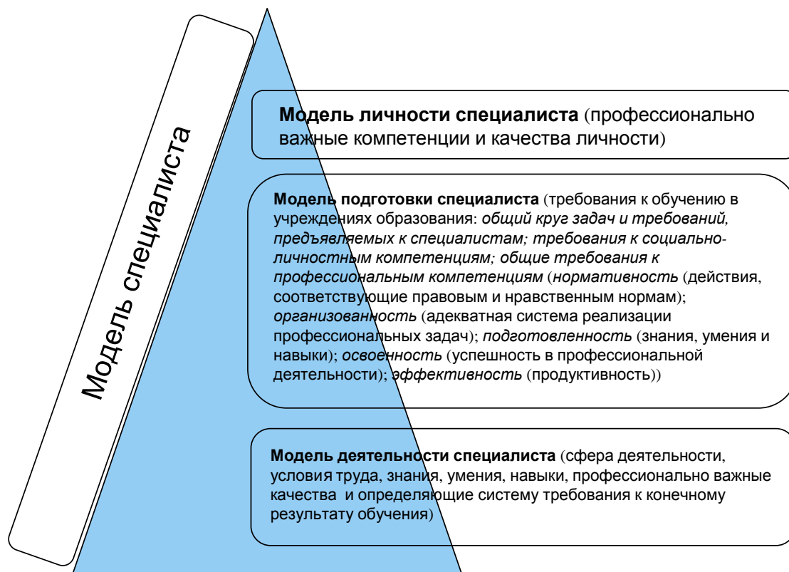
Рис. 1. Структурные компоненты модели специалиста

Ведущими компонентами в разработке структуры модели специалиста являются профессиографические и психографические исследования, которые представляют собой технологию изучения требований, предъявляемых профессией к личностным качествам, способностям и возможностям человека [3; 7].