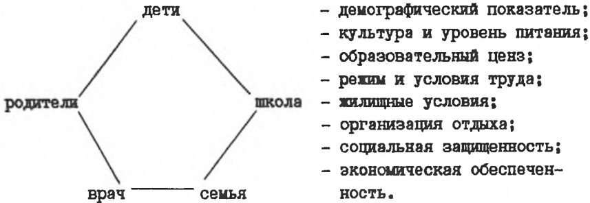
Рис. Система взаимосвязей влияющих на эффективность процесса закаливания.

В современных условиях социальная и педагогическая практика требуют деятельного подхода к организации физкультурно-оздоровительной работы и процесса закаливания. При этом, основная часть оздоровительно-педагогического направления должна на практике формировать систему воспитательных отношений (рис. ), т.е. характер преемственности.