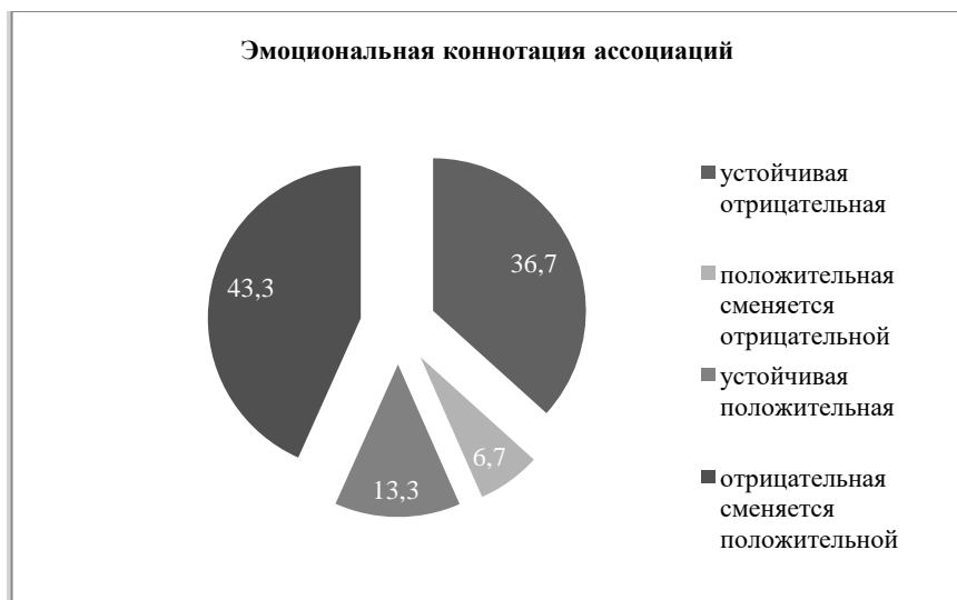
Рисунок 1 – Эмоциональная коннотация ассоциаций студентов по поводу их профессионального будущего (в %)

Поскольку каждый респондент продуцировал несколько ассоциаций, можно проследить динамику эмоционального отношения респондента к будущей профессиональной деятельности в процессе выполнения задания. Были выявлены четыре варианта динамики эмоциональной коннотации ассоциаций: сохранение отрицательной коннотации ассоциаций, сохранение положительной коннотации ассоциаций, смена положительной коннотации ассоциаций на отрицательную, смена отрицательной коннотации ассоциаций на положительную. Полученные данные о характере эмоциональной коннотации ассоциаций студентов относительно их профессионального будущего представлены на рисунке 1.