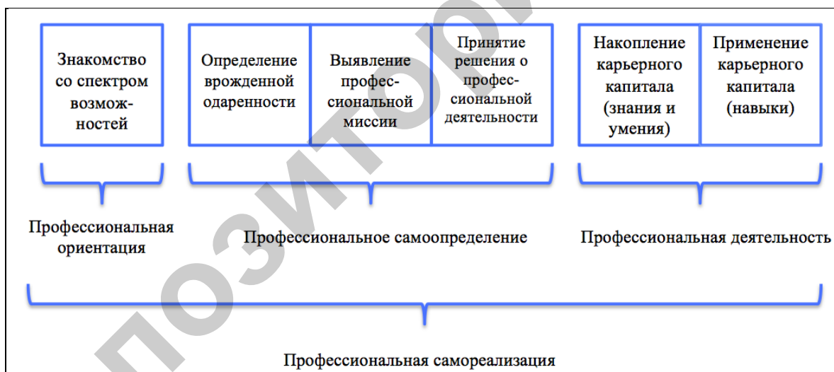
Рисунок 1. – Процесс профессиональной самореализации

Соответственно, мы выделяем три компонента профессионального самоопределения студенческой молодежи: