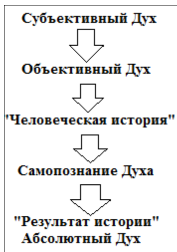
Рисунок 1. – Воплощение Духа в мировой истории в концепции Г. Гегеля

вверх, а прыжок с вершины в пропасть, чтобы затем забраться на бесконечно высокую вершину. В общем виде это может быть представлено на рисунке 1.