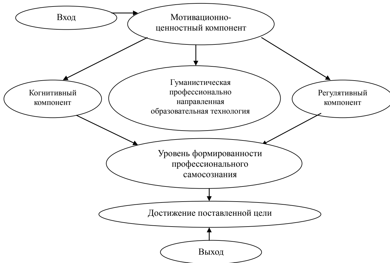
Рисунок 4 – Модель результативного блока

По результатам выходной диагностики для студента готовится индивидуальная карта личностно-профессионального развития с указанием возможных перспектив использования его как работника с учетом полученных знаний, приобретенных навыков и личностных, профессиональных характеристик. Кроме того, вся информация вносится в базу данных выпускников вуза.