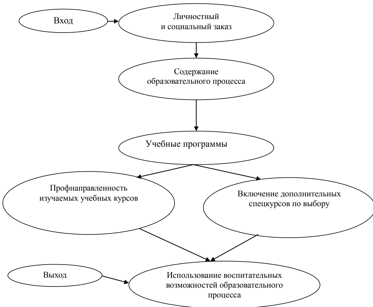
Рисунок 2 – Модель содержательного блока

Содержательный блок модели направлен на реализацию целей образовательного процесса (рисунок 2). Вход этой системы – комплекс личностных и социальных целей, а выход – использование воспитательных возможностей образовательного процесса. Содержательный блок представляет ценности перехода от культуры доминирования в обучении к культуре партнерства, сотрудничества, сотворчества .