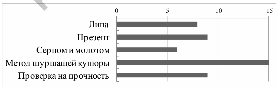
Рисунок 2.2 – Представления преподавателей о нетипичных манипулятивных техниках студентов