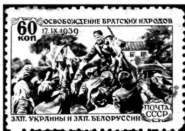
Рис. 7. «Освобождение братских народов Западной Украины и Западной Белоруссии 17 сентября 1939 г.»

Когда на рассвете мы шли работать к помещику, мы смотрели на восток, откуда всходило яркое солнце, которое восходит с той стороны, где жить хорошо. Мы слышали гул тракторов на необозримых колхозных полях, мы видели зарево от множества электрических ламп, освещающих советские села. Настали, наконец, радостные дни и в нашей жизни, сбылись наши мечты 1 .