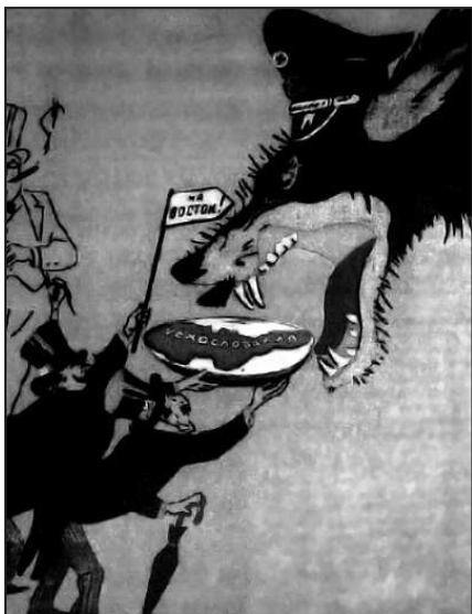
Рис. 9. Плакат, осуждающий «Мюнхенский сговор»