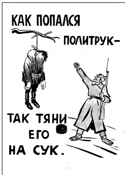
Рис. 18. Финская агитационная листовка