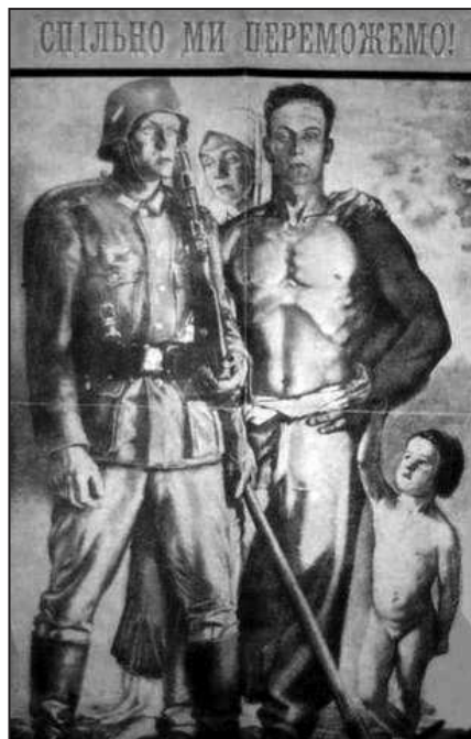
Рис. 12. «Вместе мы победим!»

за мировую революцию ставит целью сделать все народы рабами так, как это уже сделали с Вами.