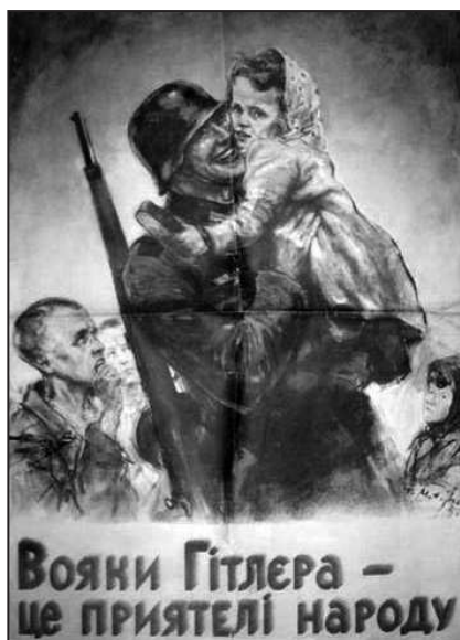
Рис. 13. «Солдаты Гитлера – друзья народа»