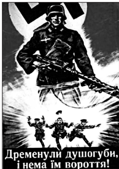
Рис. 11. «Драпанули душегубы и нет им возврата»