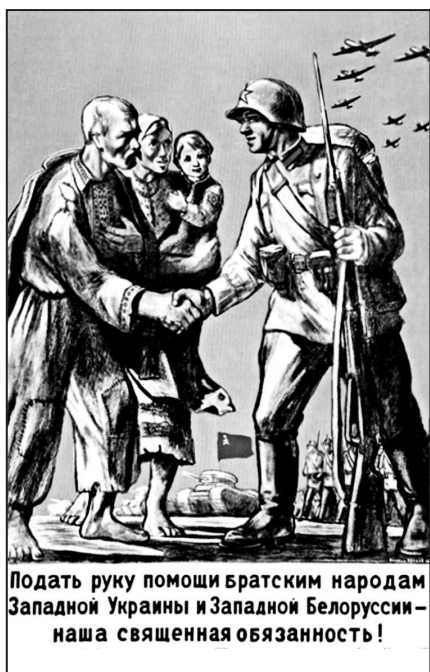
Рис. 4. В. С. Иванов. «Подать руку помощи братским народам Западной Украины и Западной Белоруссии – наша священная обязанность!»

благодарности, а красноармеец левой рукой опять-таки крепко сжимает винтовку со штыком. На заднем плане во всей мощи наступает Красная армия: танки, пехота, авиация. С точки зрения цветовой подачи плакат довольно лаконичен, однако акценты красного цвета расставлены очень четко: окантовка красной звезды на каске, красное знамя наступающих советских частей, красная вышивка на национальных крестьянских костюмах и красные буквы надписи о помощи братским народам.