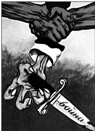
Рис. 10. Советский антивоенный плакат

«собирация немецких земель» Германия осуществляла под лаконичным и емким лозунгом «Один народ, один рейх, один вождь». Советская пропаганда не породила подобного лозунга, однако в ее идеологических клише – «единокровные братья», «советская страна», «великий вождь» и т.п. – можно найти аналог практически всем его составляющим.