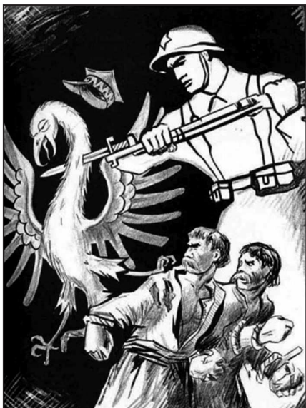
Рис. 2. «Польский орел и советский солдат»