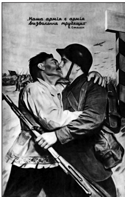
Рис. 1. В. Б. Корецкий «Наша армия есть армия освобождения трудящихся»

С точки зрения такого открытого выражения эмоций примечателен плакат известного советского художника-плакатиста В. Б. Корецкого «Наша армия есть армия освобождения трудящихся» (рис. 1), (в книге В. Корецкого «Товарищ плакат», изданной в 1978 г., использовано другое название – «Боец, Белоруссия ждет этого дня!» 2 ). Именно эта работа принесла первую широкую известность своему автору. 22 сентября 1939 г. плакат был помещен на 1-й странице «Правды» 3 . Затем «он воспроизводился в журналах и газетах, в школьном учебнике истории СССР, печатался в календарях и т.д.» 4 . Сопроводительный текст – «Наша армия есть армия освобождения трудящихся». И. Сталин» – приводился на русском, белорусском или украинском языках.