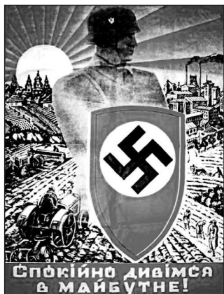
Рис. 15. «Спокойно смотрим в будущее»

«великой Германии». В национал-социалистских плакатах и листовках отчетливо звучал мотив долга перед «избавителями»: «Работая в Германии, ты защищаешь свое отечество! Иди в Германию!», «Украинцы! Включайтесь в европейский фронт обороны против большевизма!» и т.д.