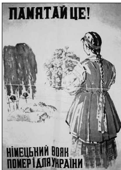
Рис. 14. Помните! Немецкий солдат погиб и за Украину»

«великой Германии». В национал-социалистских плакатах и листовках отчетливо звучал мотив долга перед «избавителями»: «Работая в Германии, ты защищаешь свое отечество! Иди в Германию!», «Украинцы! Включайтесь в европейский фронт обороны против большевизма!» и т.д.