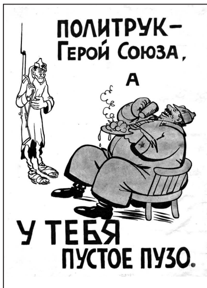
Рис. 17. Финская агитационная листовка

В целом, советскую пропагандистскую кампанию осени 1939 г. можно признать успешной. Ее положительно восприняла армия, гражданское население СССР и население Западной Украины и Западной Белоруссии.