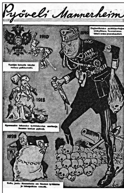
Рис. 16. Мясник Маннергейм»

В условиях тяжелой ситуации, сложившейся на финском фронте в начале 1940 г., пришлось перестраивать пропагандистскую работу в самой РККА, об «освободительной миссии» которой говорить уже не приходилось. Высокий боевой дух финской армии не шел ни в какое сравнение с боевым духом отступающего почти без сопротивления в сентябре 1939 г. Войска Польского. Руководство Политического управления Красной армии было вынуждено перестраиваться «на ходу». 4 февраля 1940 г. в действующую армию была направлена директива ПУРККА за № 29 «О задачах агитационно-пропагандистской работы в связи с финляндской войной». В директиве утверждалось следующее: вместо повседневногo разъяснения личному составу, что основной задачей в этой