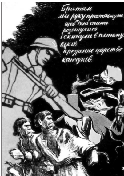
Рис. 3. «Царство канчуков»

из рук. Тем не менее, никакого сочувствия к поверженной армии, защищавшей, кстати, свое государство, у зрителя не может и не должно быть, ведь с выбитой из рук сабли капает свежая кровь, а в рукоять плети (канчука) пальцы офицера вцепились намертво.