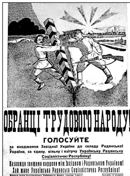
Рис. 5. Л. Сечишин. Предвыборный плакат

– Мы знали, – говорит он, – как радостно живет крестьянство по ту сторону границы, в советской стране.