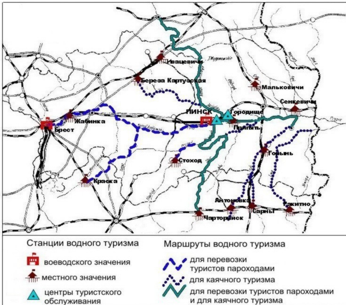
Рисунок 2 – Объекты водного туризма и речная туристская сеть

При организации водного туризма как спортивного, так и познавательного, рекомендовалось внедрять элементы других видов туристской деятельности. Результатом этого явилось объединение и комбинирование разных видов туристской деятельности. Прохождение маршрута на байдарках либо лодках целесообразно было совмещать с остановками на территории складывающихся рекреационных зон, которые в свою очередь были приурочены к озерам. Такими зонами являлась шацкая группа озер; озера Белое, Rogoznenskoe, Меднянское – при прохождении маршрута по реке