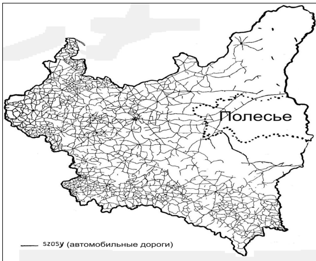
Рисунок 1 – Обеспеченность шоссейными дорогами с твердым покрытием в Польше на Полесье (1935 г.)

и межгосударственных коммуникациях, что было связано с разной шириной колеи, а также с их незначительной протяженностью. Протяженность дорог европейской («нормальной») колеи составляла – 770 км, а узкоколейных – 220 км. Ограничением в использования железных дорог в туристских целях являлось также несогласованность в отправлении и прибытии поездов по ключевым направлениям туристских маршрутов. Общим недостатком функционирования туристско-экскурсионных маршрутов являлись большие временные затраты на посещения туристских объектов. В качестве примера значительных временных затрат может служить маршрут Горынь – Лунинец – Брест. При прохождении маршрута туристам по прибытию из деревни Горынь в Лунинец необходимо было ждать поезд в направлении Бреста в течение 5 часов 35 минут, что обусловило незначительный спрос на данный туристский маршрут [1; 2; 7].