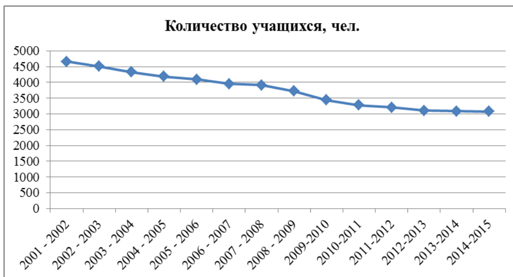
Рисунок 1. – Динамика количества учащихся школ Малоритского района с 2001 по 2014 гг. (составлено по [6; 7])

В 2000-х гг. были закрыты все начальные школы района. На базе 5 сельских школ созданы учебно-педагогические комплексы: детский сад – средняя школа (деревни Збураж, Гвозница, Ляховцы и Доропеевичи) и детский сад – базовая школа (д. Замшаны). Были закрыты базовые школы в д. Высокое и д. Заболотье, а в 2012 г. и в д. Хмелевка.