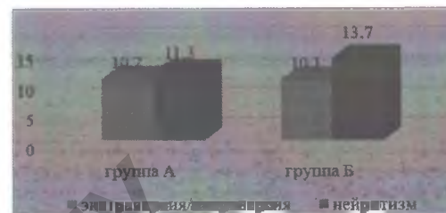
Рис. 1. Усредненные показатели индивидуально-психологических особенностей первокурсников (М)

Диапазон данных от 0 до 11 определяют интроверсию, 12 баллов соответствуют амбивертности, от 12 до 24 баллов – экстраверсии. Больше 19 баллов – очень высокий уровень нейротизма, больше 13 – высокий уровень нейротизма, 9–13 – среднее значение, меньше 9 – низкий уровень нейротизма.