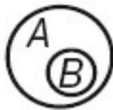
Рисунок 3 – Подчиняющиеся понятия

Выявленные в итоге анализа признаки терминов «жестокое обращение» (осознанность, активность и/или пассивность действий или бездействие, разнообразие форм воздействия) и «насилие» (осознанность и/или неосознанность действий, применение преимущественно физической силы) являются эмпирическими референтами операционализации данных понятий, создающими предпосылки для более глубокого анализа и построения прикладных исследований по проблеме жестокого обращения в семье.