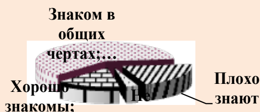
Рисунок 2 – Распределение ответов на вопрос: «Знакомы ли Вы с содержанием Конституции?», %

Хотелось бы отметить, что уровень правового сознания измеряется не только отношением к правовым нормам, определением их предназначения в современном обществе, но и знанием основных правовых положений, а также успешной правовой социализацией. Для того чтобы оценить уровень правовой образованности, мы решили спросить, насколько хорошо знают наши соотечественники содержание Конституции Республики Беларусь. Ответы на поставленный вопрос распределились следующим образом (рисунок 2).